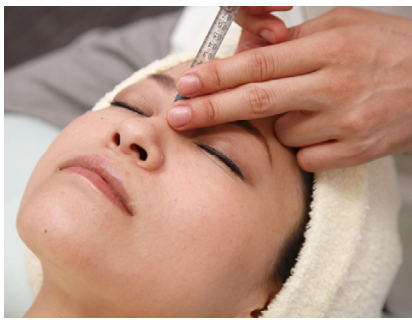
注入時の痛みさえもないから気楽。

世界最大規模の美容医療メーカーで信頼も高いアラガン社の新ヒアルロン酸・ジュビダーム。麻酔入りなのでこれまでのような注入痛がなく、長期にわたる効果の持続はFDAのお墨つき！